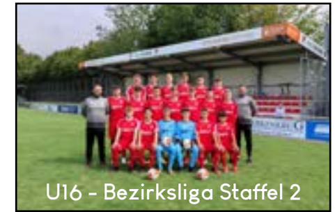
U16 - Bezirksliga Staffel 2