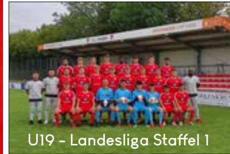
U19 - Landesliga Staffel 1