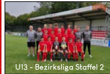
U13 - Bezirksliga Staffel 2