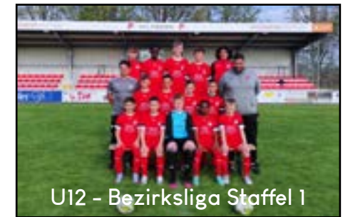
U12 - Bezirksliga Staffel 1