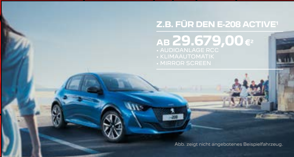
Abb. zeigt nicht angebotenes Beispielfahrzeug.