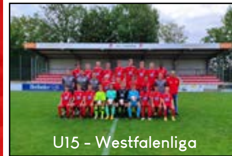
U15 - Westfalenliga