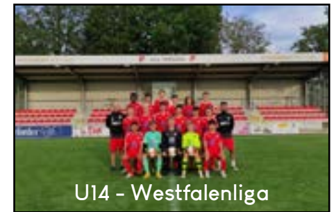
U14 - Westfalenliga